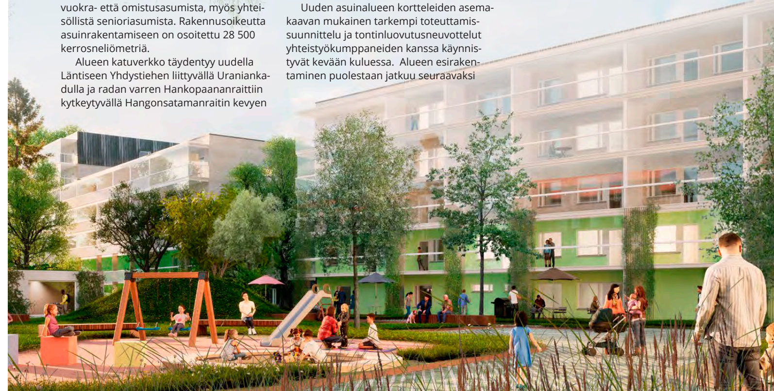
Alustava havainnekuva Läntisen yhdistien puoleisen korttelin sisäpihalta / Mangrove Oy / Arkkitehtitoimisto Ajak Oy

Kaavoitustyö etenee keväällä 2023 rinnan koulun ja päiväkodin hankesuunnittelun kanssa. Asemakaavan luonnos on tarkoitus valmistella nähtäville syksyllä 2023, kun hankesuunnitelma on laadittu. Tavoitteena on, että kaava olisi hyväksymiskäsittelyssä kaupunginvaltuustossa keväällä 2024.