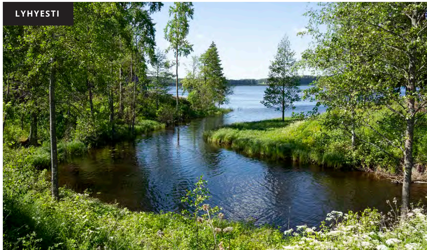
KUVA: JANNI ANTTILÄTVALA