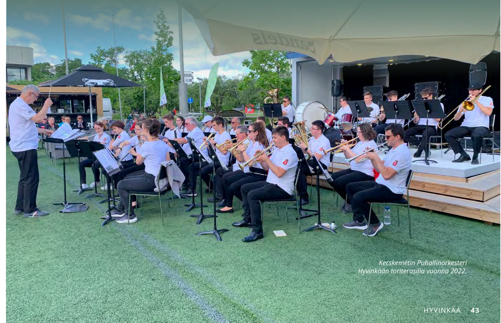
Kecskemétin Puhallinorkesteri Hyvinkään toriterasilla vuonna 2022.

Katsotaan, mitä tulevaisuus tuo tullessaan. Kansainvälinen yhteistyö kannattaa aina.