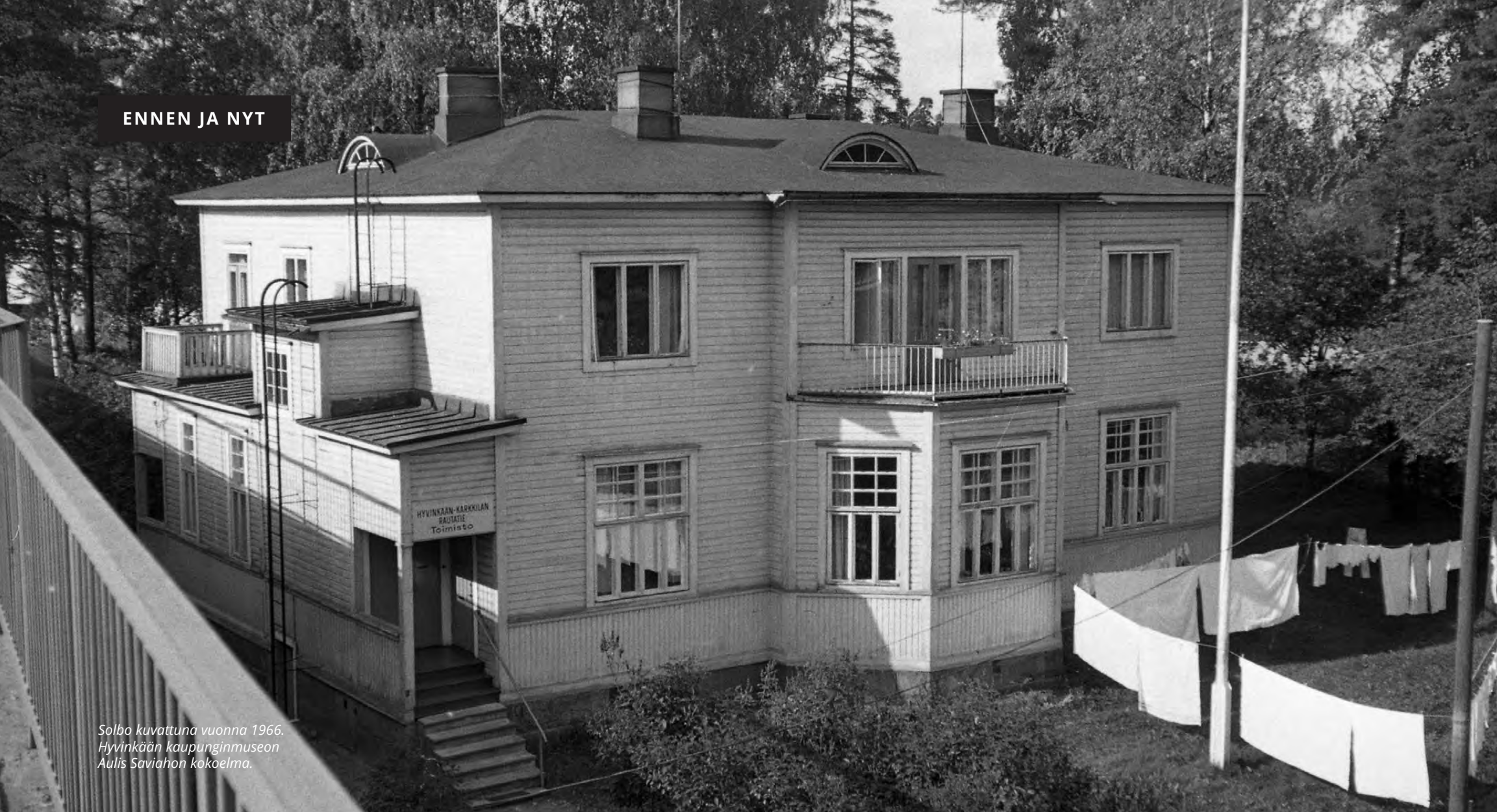
Solbo kuvattuna vuonna 1966.